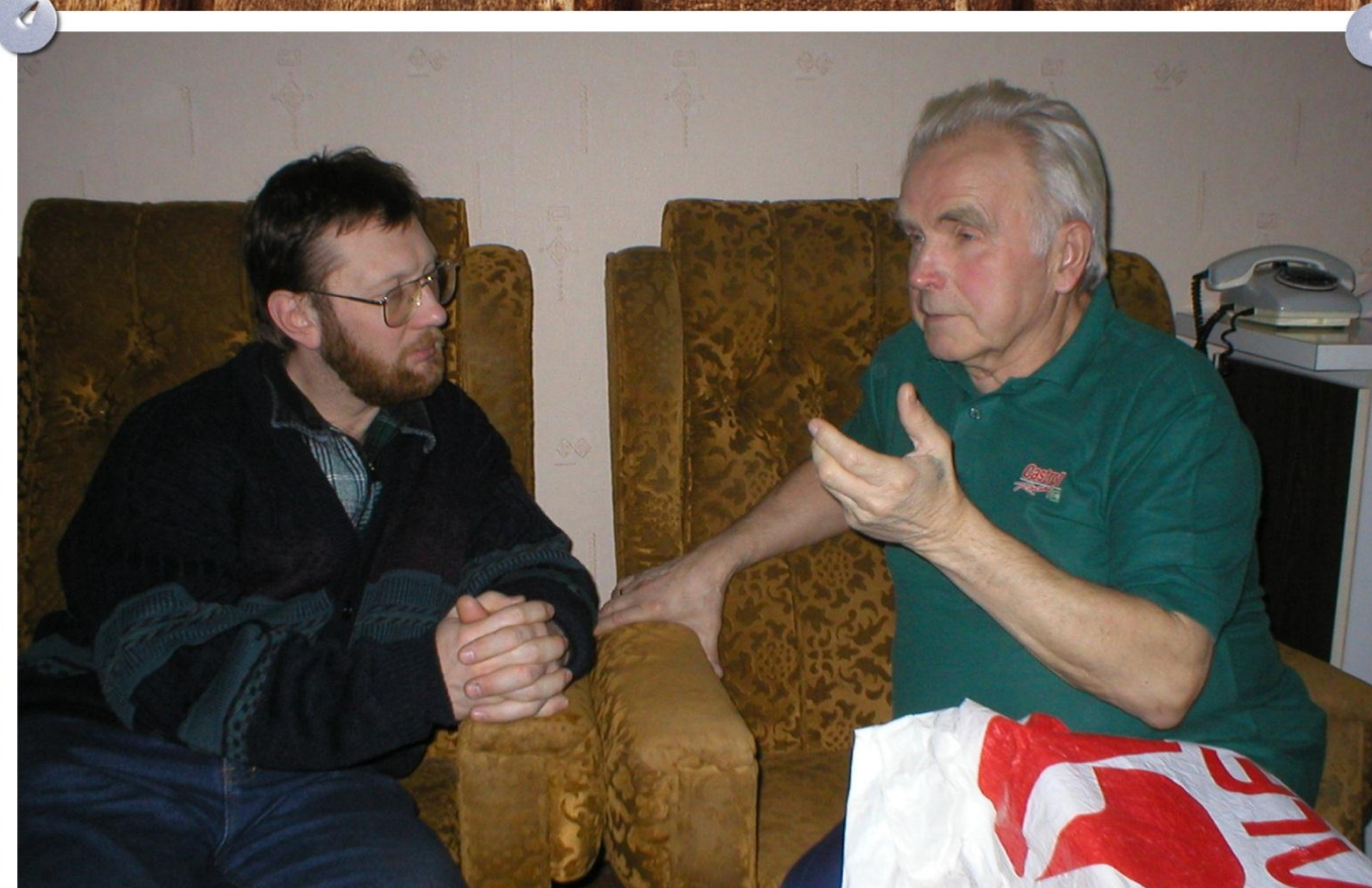
Первая беседа об истории отечественного автоспорта