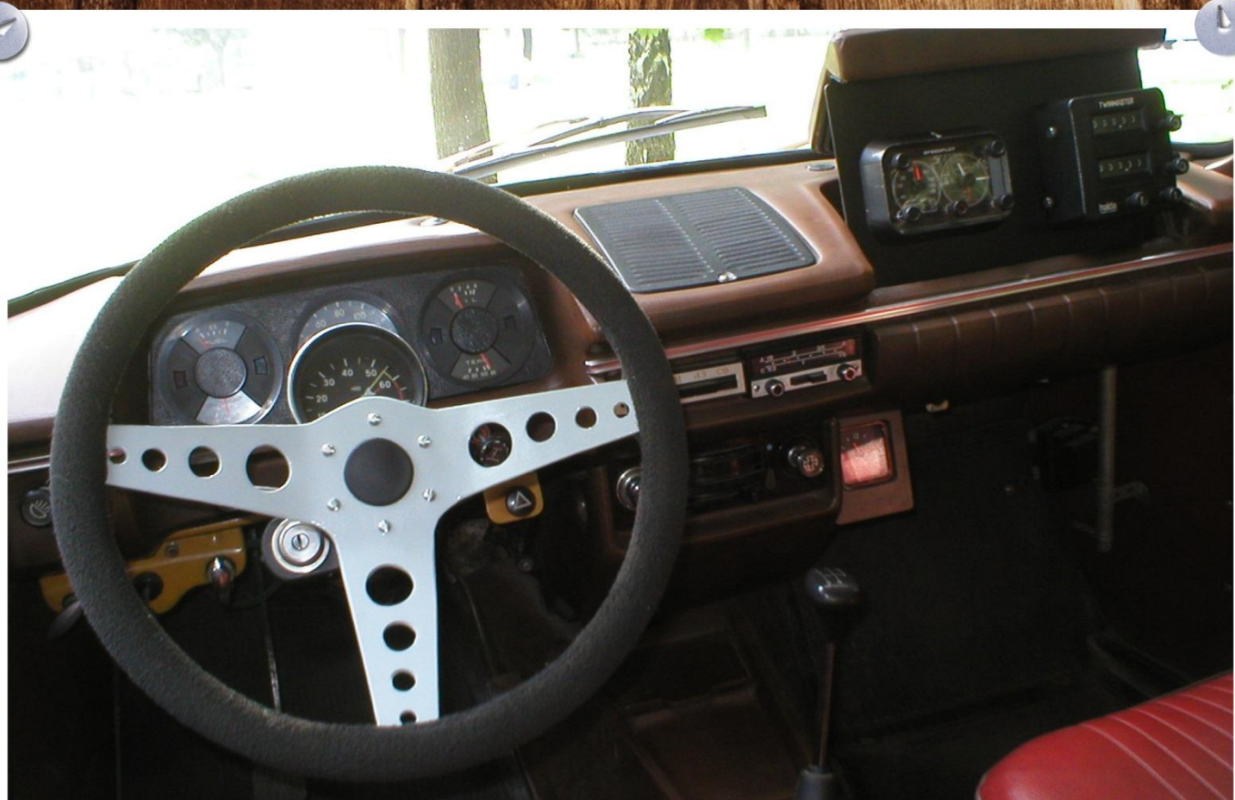
Самодельный спортивный руль, тахометр, штурманские приборы "HALDA"