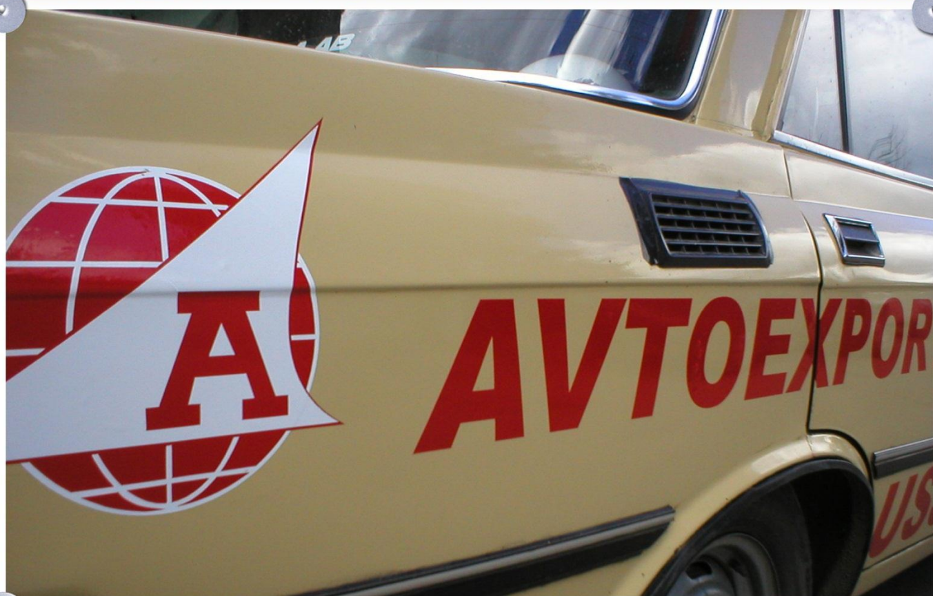
Наклейки "АВТОЭКСПОРТ" полностью соответствуют оригиналу