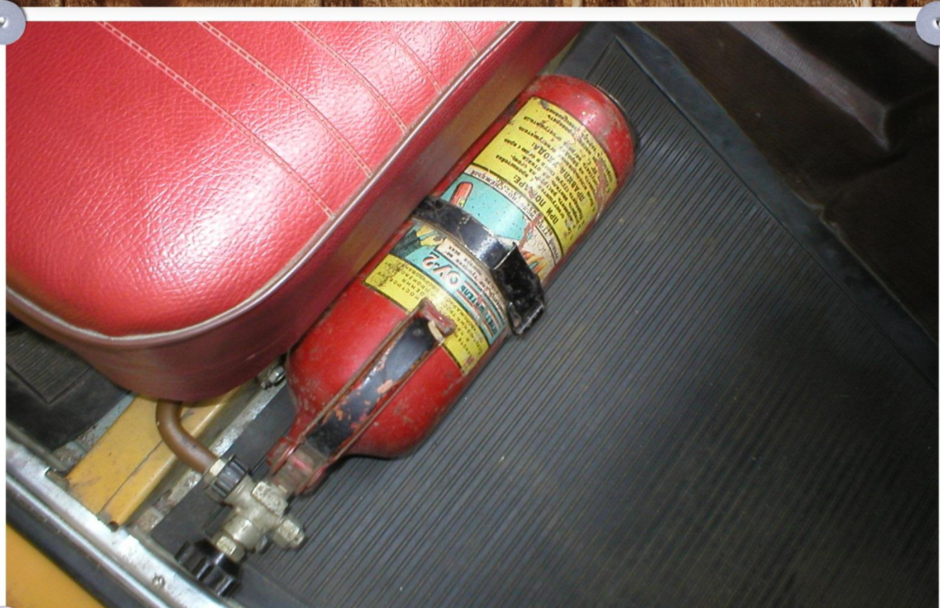
Оригинальный советский огнетушитель ОУ-2