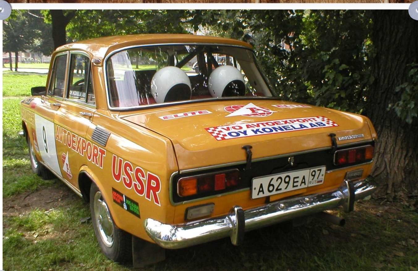
Переходная модель с М-412 на М-2140