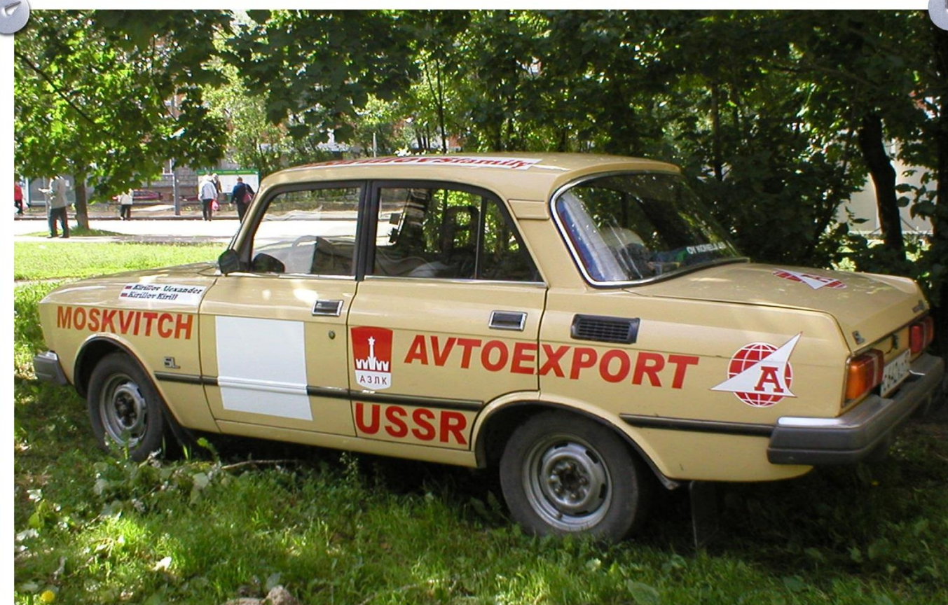
"Москвич" с советской рекламой вызвал большой интерес на дорогах