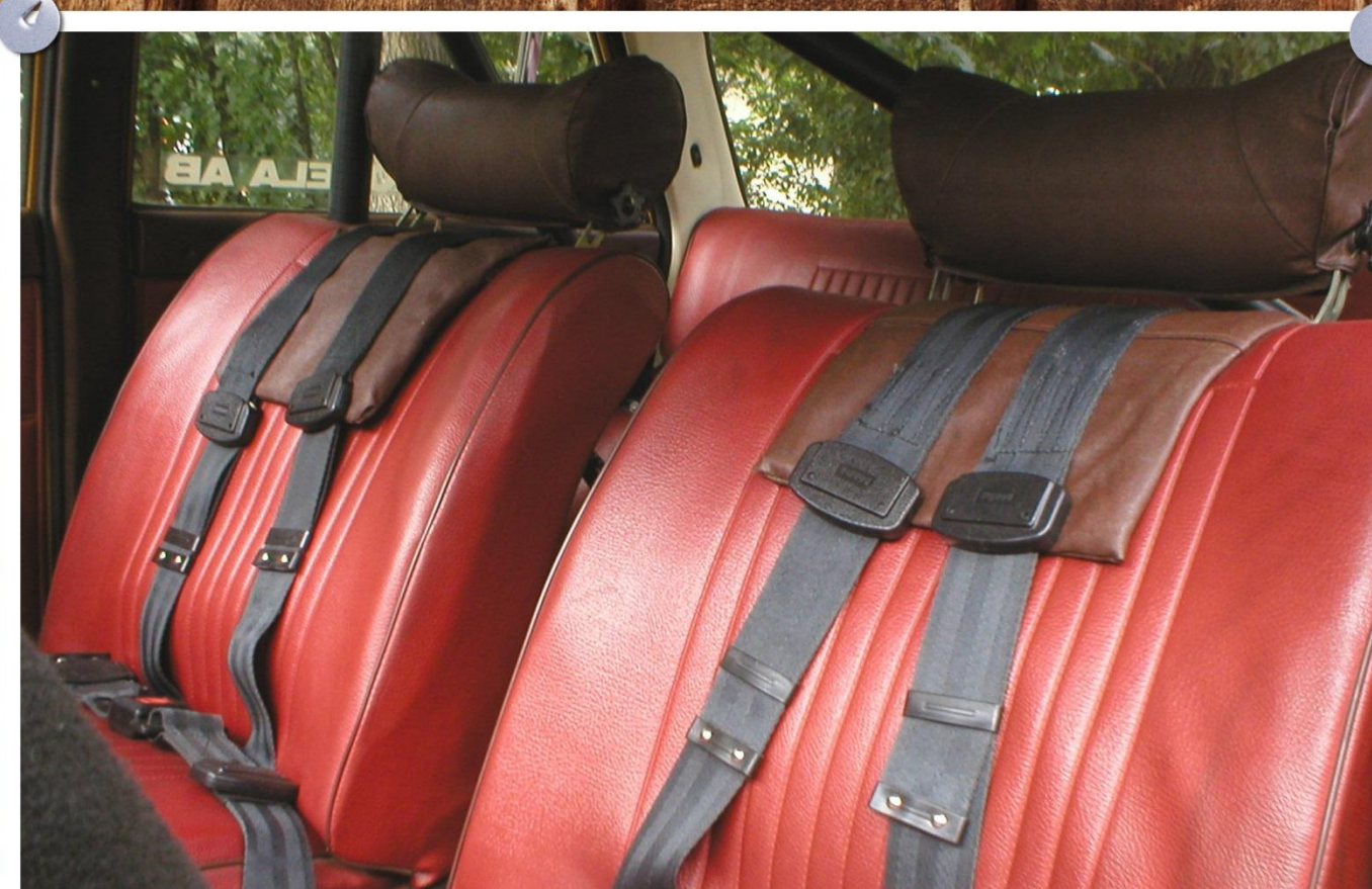
Трёхточечные ремни безопасности "NORMA"