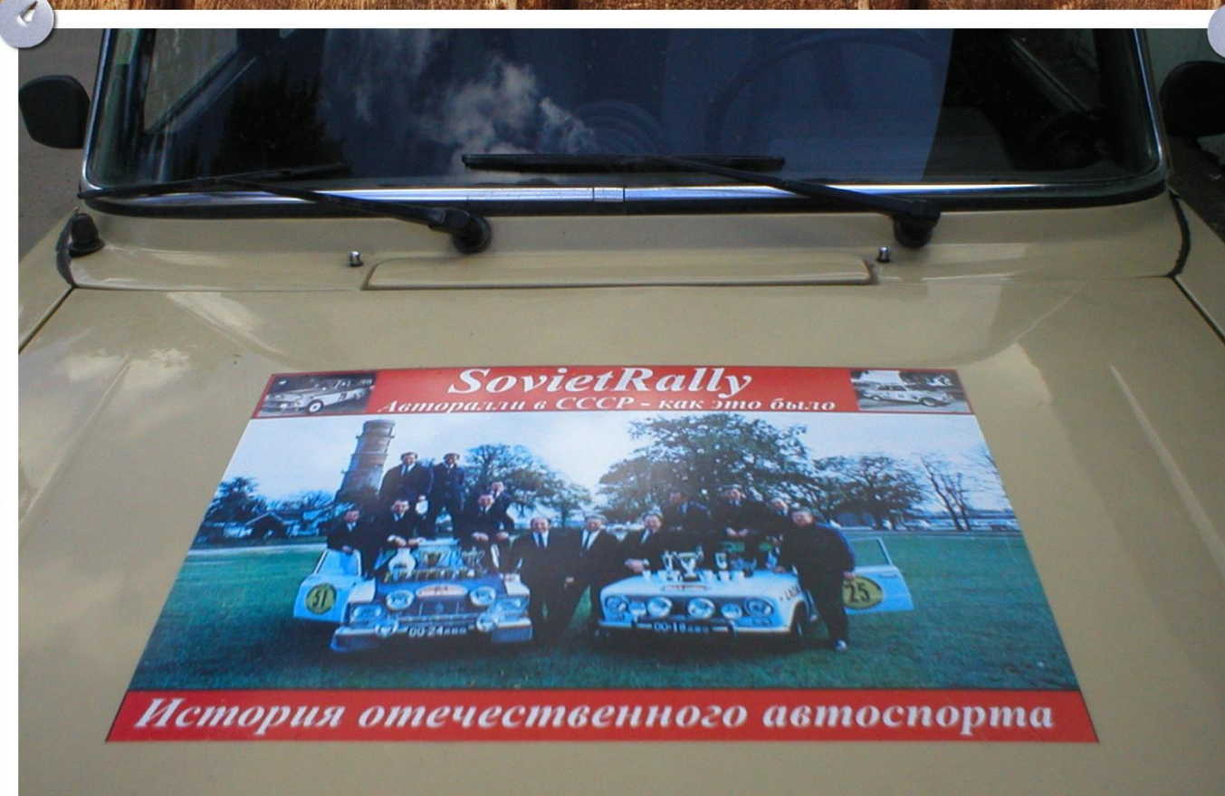
Первый рекламный баннер "Советского ралли"