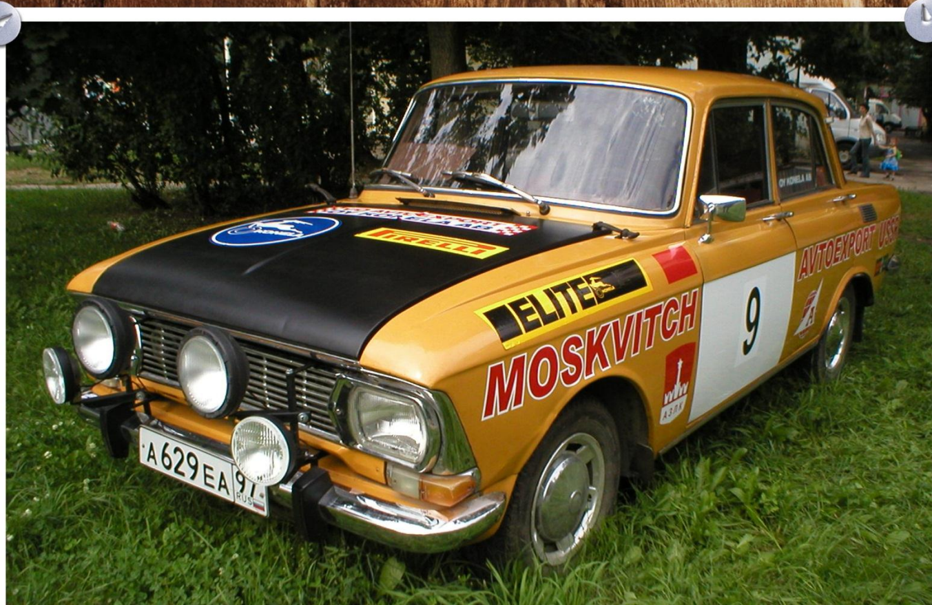
Первый спортивный автомобиль проекта "SovietRally"