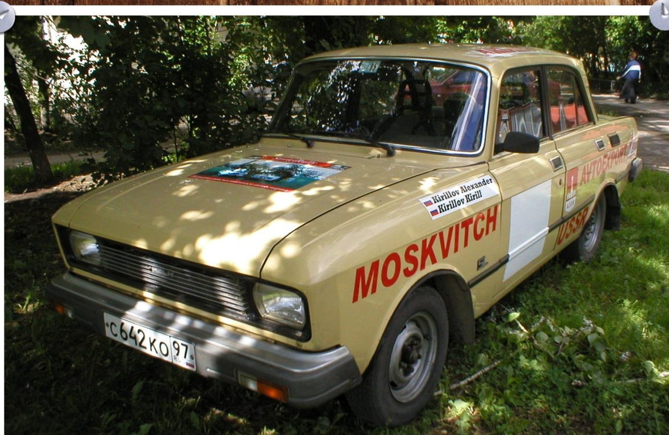
Рекламный автомобиль проекта "SovietRally" - Москвич-2140 SL