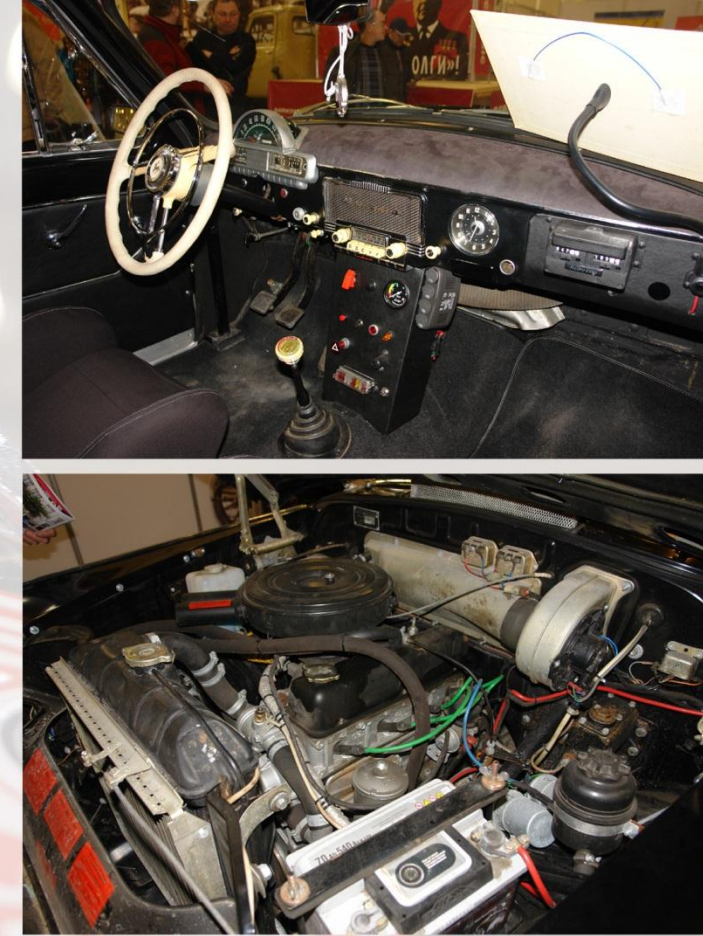
ГАЗ-21 "ВОЛГА" ИЗ МОНТЕ-КАРЛО

Но самым интересным экспонатом выставки стал автомобиль ГАЗ-21 "Волга". Это уже не реплика, а настоящий гоночный автомобиль, принимавший участие в ралли "Монте-Карло 2012". Автомобиль построен действительно очень качественно и хорошо продуманно. Притом, полностью сохранен его исторический облик - внешне автомобиль повторяет те самые наши "Волги", которые участвовали в ралли "Монте-Карло" в 1964 и 1965 годах. Однако, в отличие от "Москвича", эти "Волги" сделаны не для того, чтобы стоять в музее, а для самых настоящих гонок - уже в этом году они приняли участие в ралли "Монте-Карло" для исторических автомобилей. Только вот, в отличие от московских ретро-ралли, это ралли имеет протяженность не 100 км, а больше тысячи, и не по простой дороге, а по горам. Для участия в таком значимом и ответственном историческом ралли, четыре отважных экипажа заявили как команда «Russian Racing Team». Местом старта «звездного сбора» была выбрана Барселона. Все «Волги» стартовали друг за другом. Пять дней труднейшего и красивейшего маршрута - и все четыре экипажа команды пересекли финишную черту! Всего в этом мероприятии стартовало 306 экипажей, но до финиша дошли всего 214 машин, - не смогли выдержать сложнейшие моральные испытания и физические нагрузки, да и техника иногда отказывала. Наилучший результат достигнутый командой - 95-е место в общем зачете и 7-е место в своей возрастной категории. Это огромный прорыв спустя 50 лет!