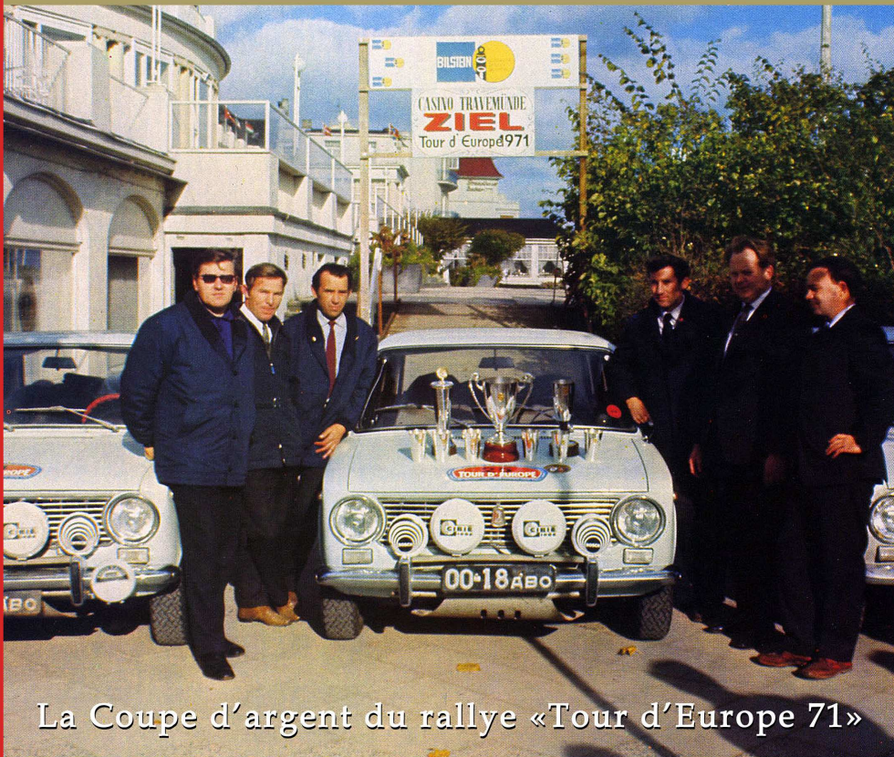
La Coupe d'argent du rallye «Tour d'Europe 71»